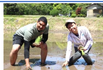
2023年5月田植え体験の様子

兵庫県神崎郡神河町と神戸情報大学院大学は、双方の資源を有効に活用した協働による活動を推進し、地域創生と産業人材育成に資することを目的とした包括連携協定を2021年3月に締結しました。本学の強みである「ICTによる地域課題解決」で貢献することを目指して、PBL（プロジェクト・ベースド・ラーニング）に取り組むほか、神河町の小中高生と本学の留学生が英語で交流する「オンライン世界授業」も定期的に開催しています。