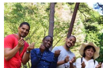
アフリカをはじめとした留学生達との交流会もあります。

2005年に設立。神戸電子専門学校を運営する「学校法人コンピュータ総合学園」が母体の専門職大学院です。日本政府奨学制度「アフリカの若者のための産業人材育成イニシアティブ」等を通して、これまで世界から80カ国以上、特にアフリカからは36ヶ国から227名の留学生（2022年10月現在 短期研修員を含む）を受け入れて参りました。修了生は神戸、日本、アフリカ、及び世界各地で活躍しています。近年、「日本／世界銀行 共同大学院奨学金制度（JJ/WBGSP）」採択校（2020～2021年度）、独立行政法人 国際協力機構（JICA）理事長賞（2019）受賞他実績多数。