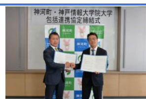
包括連携協定締結式の様子

兵庫県神崎郡神河町と神戸情報大学院大学は、双方の資源を有効に活用した協働による活動を推進し、地域創生と産業人材育成に資することを目的とした包括連携協定を2021年3月に締結しました。本学の強みである「ICTによる地域課題解決」で貢献することを目指して、PBL（プロジェクト・ベースド・ラーニング）に取り組むほか、神河町の小中高校生と本学の留学生が英語で交流する「オンライン世界授業」も定期的に開催しています。